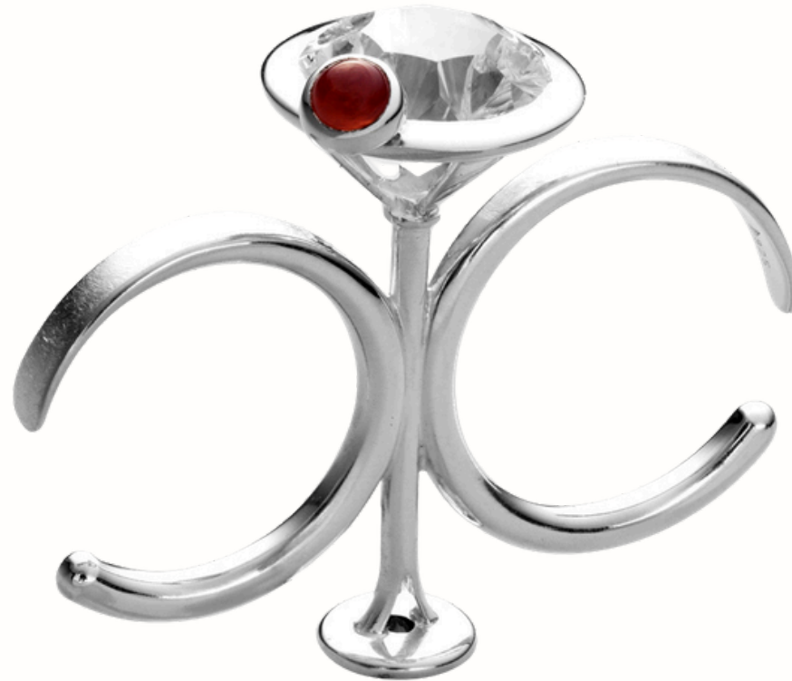
La bague Martini Petra Luz