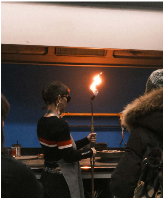
Démonstration lors de la Nuit blanche