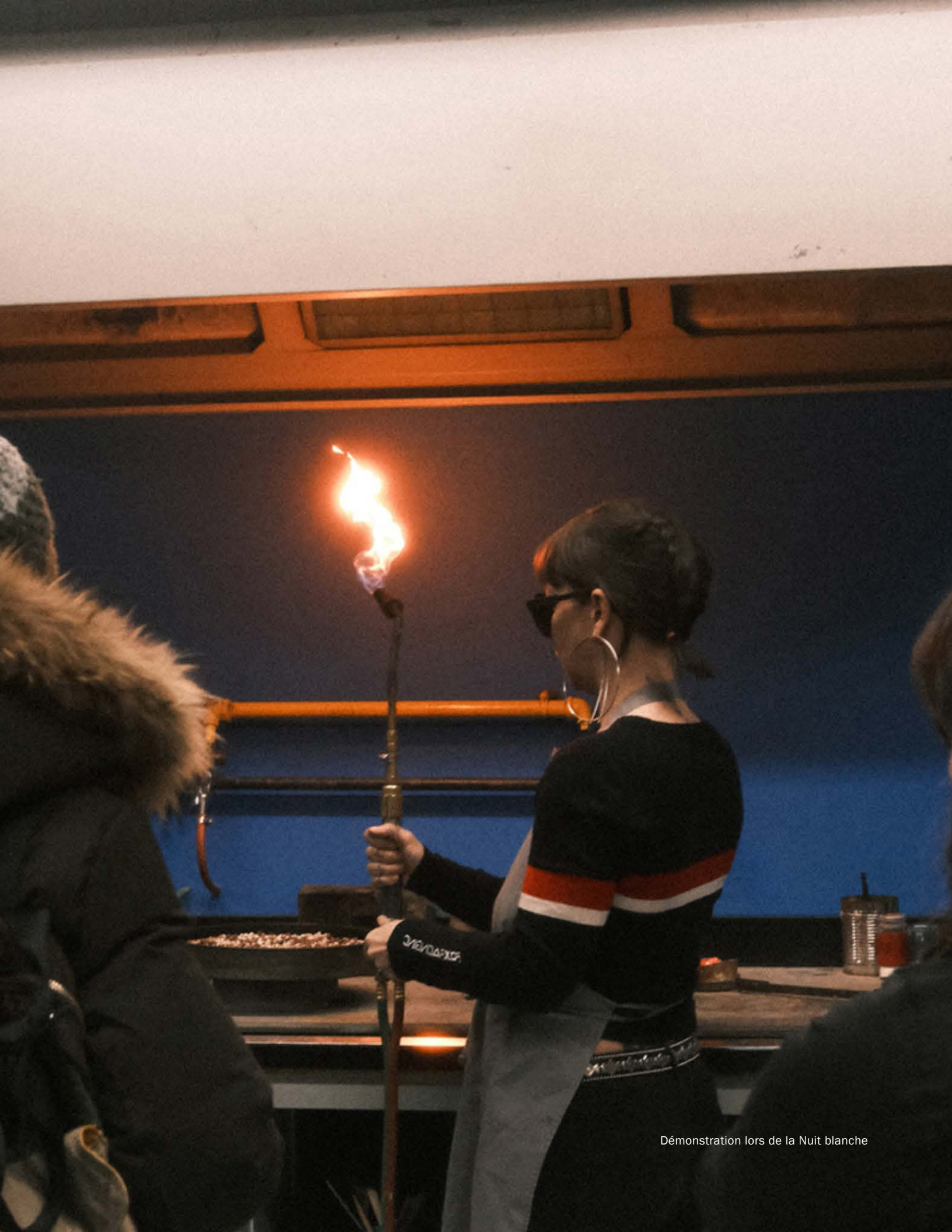
Démonstration lors de la Nuit blanche