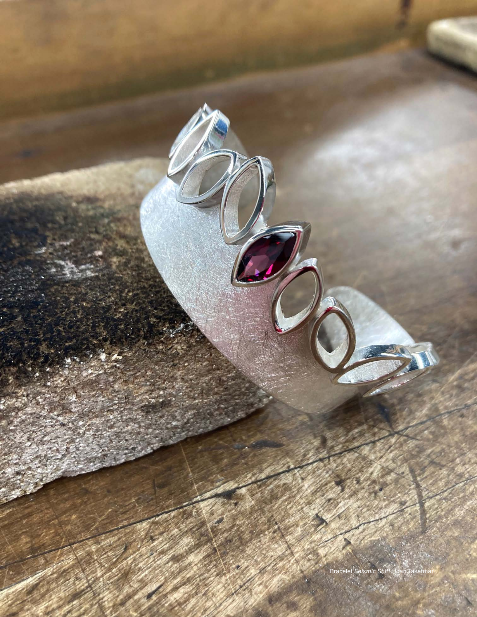
Bracelet 'Seismic Shift', Joan Takefman