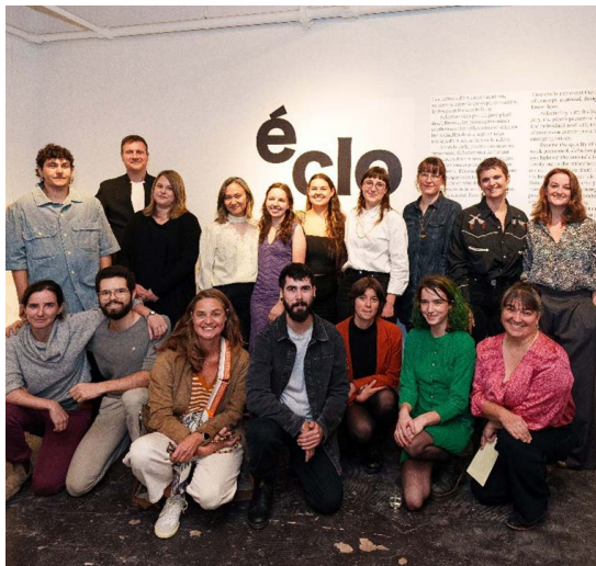
Artistes participant à l'exposition Écllosion