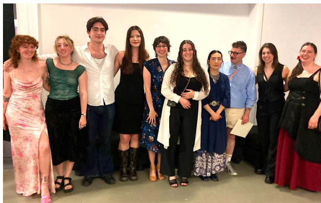
Finissantes du DEC lors du vernissage de l'exposition Métal Morphose

Nous avons également eu le plaisir de remettre plusieurs prix d'excellence à nos étudiantes de tous les niveaux, grâce au soutien précieux de nos fournisseurs et partenaires. Ces prix représentaient une valeur totale de 12 000 $, sous forme de bourses, de certificats-cadeaux, ainsi que de produits et services professionnels. Les prix d'excellence contribuent de manière significative au lancement de la carrière de nos étudiantes et diplômées.