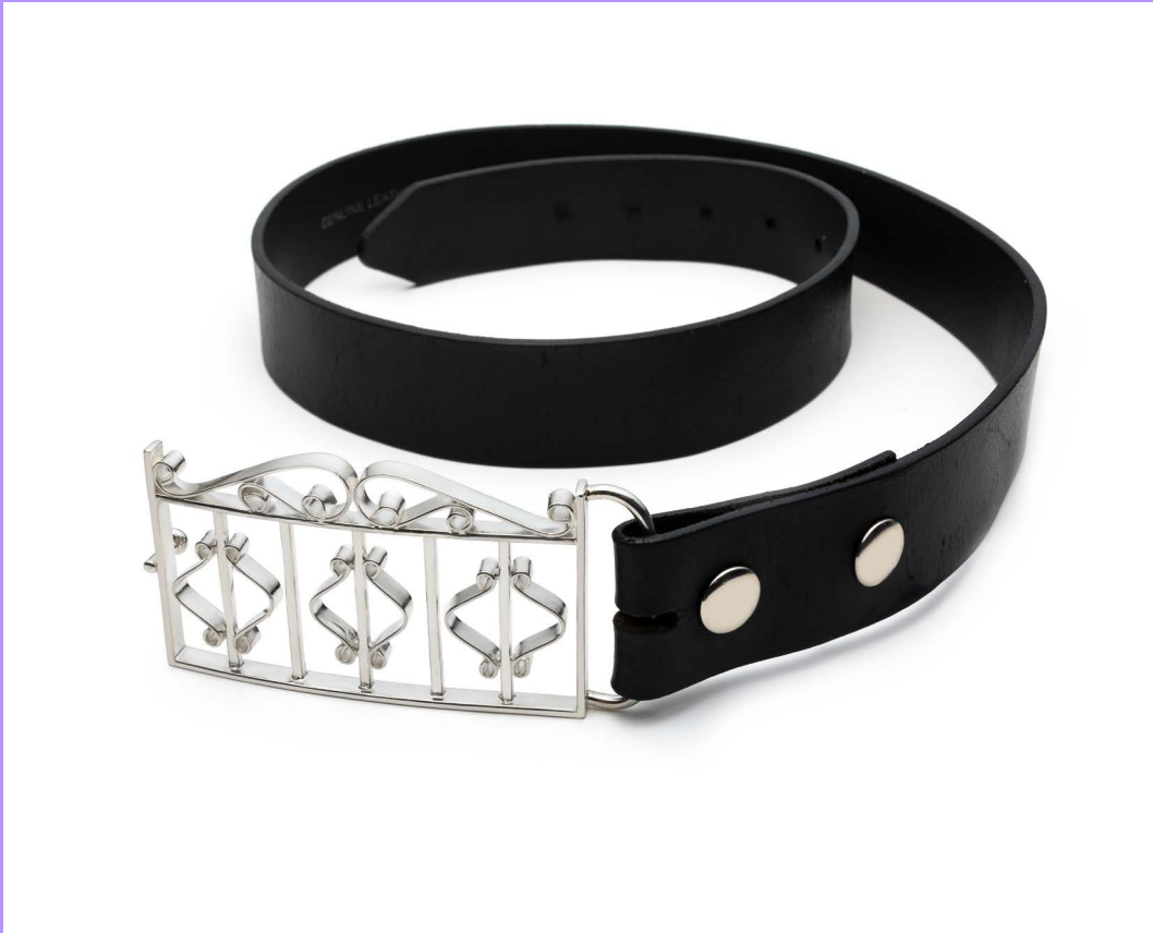
Boucle de ceinture L'entrée , Biaggio Carnevale