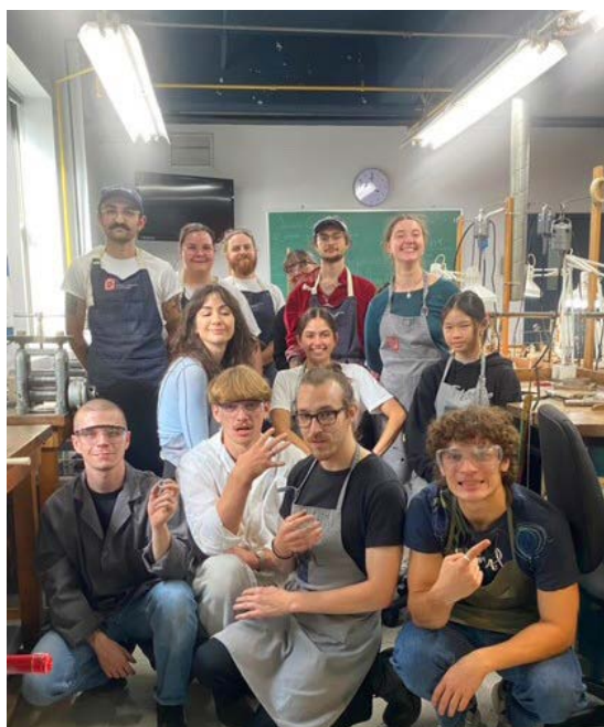
Étudiantes ayant participé à la journée ADÉSAQ