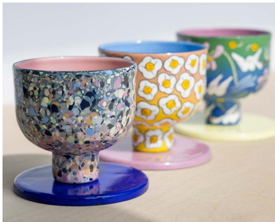
Œuvres d'Aurélie Guillaume dans l'exposition Le Picnic à la Galerie Noel Guyomarc'h