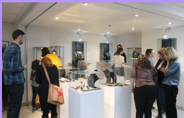
Exposition-gala des étudiantes des programmes Techniques de base et des cours de perfectionnement.