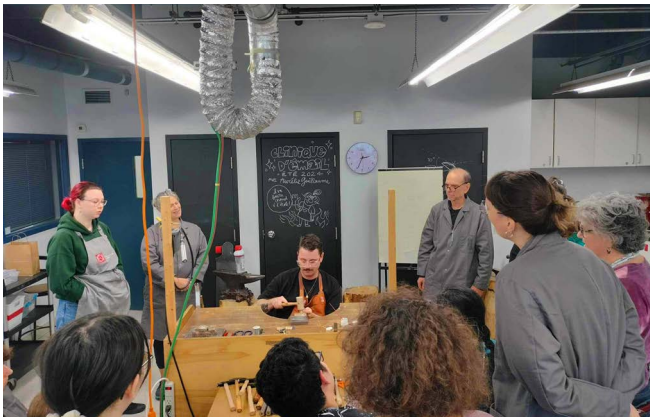
Atelier de fabrication de joncs dans le cadre des Journées de la culture

La promotion des programmes de l'École de joaillerie de Montréal passe en bonne partie par les rencontres avec le public. Notre présence dans divers salons et événements ainsi que l'accueil du public dans nos espaces contribuent activement à notre rayonnement et à la visibilité de nos formations.