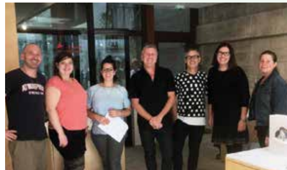
Espace habité / Inhabited space — Paris, septembre 2017

Photo page couverture Bracelet Itado de Matthieu Cheminée, 2018