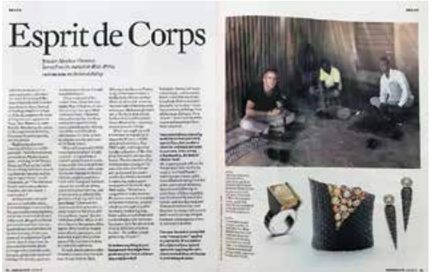
American Craft Magazine