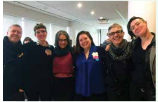
Schmuck 2018 — Allemagne, mars 2018