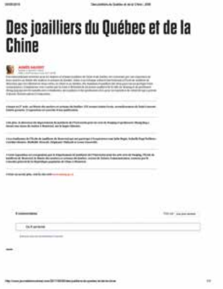
Journal de Montréal