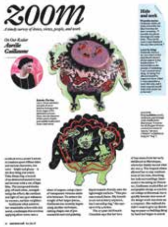
American Craft Magazine