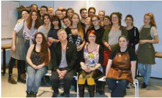
Gala des bénévoles — mars 2018