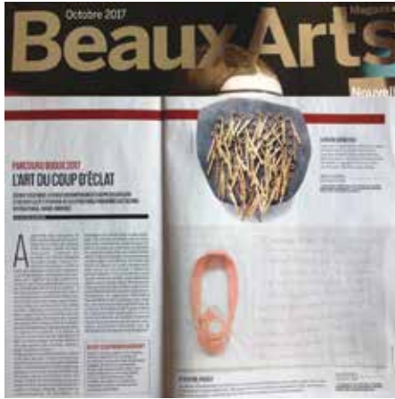
Beaux Arts magazine