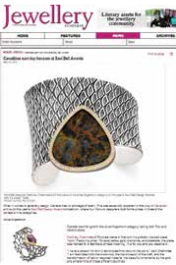
Canadian Jewelry Business magazine